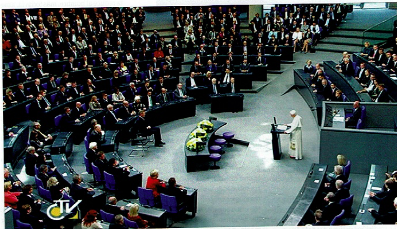
Benedicto XVI hablando en el Parlamento alemán.

tuétanos. Nunca entendí cómo unos arquitectos tan prestigiosos como los norteamericanos pudieran hacer unas instalaciones tan inhumanas, que realmente expulsaban de sus entrañas opresoras a los usuarios.