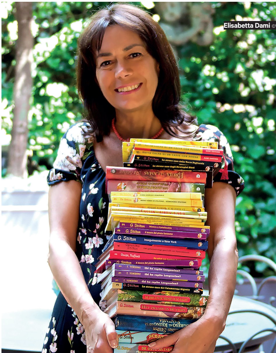
Elisabetta Dami