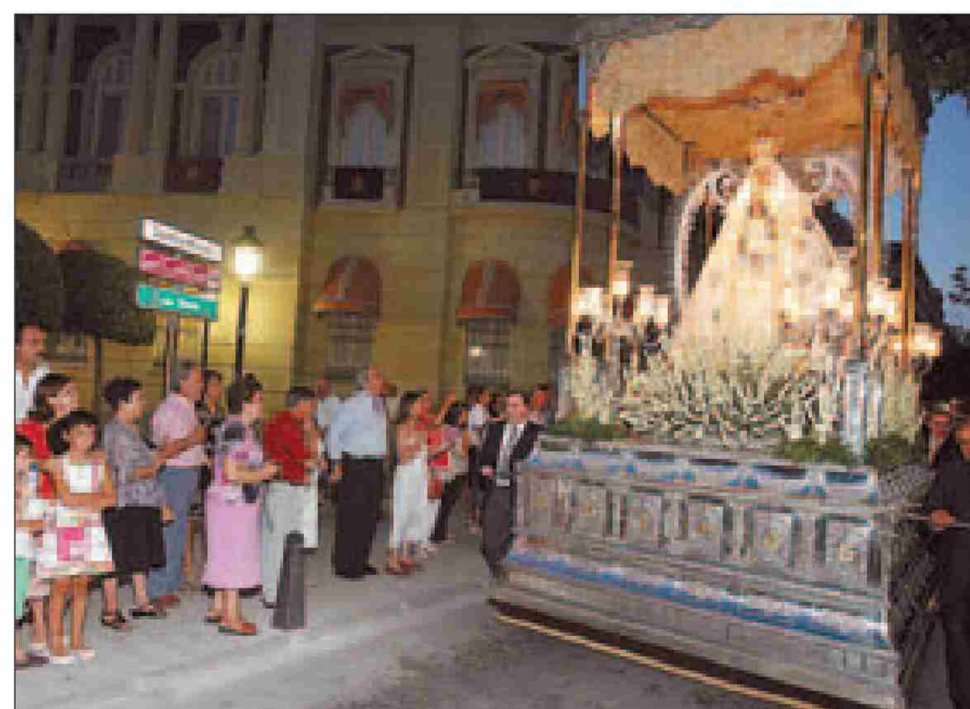
Varios ciudadrealeños contemplan a la Virgen del Prado.

Virgen del Prado, previa a la celebración de la Feria de agosto, será el sábado 13, con la tradicional caravana blanca, en la que enfermos