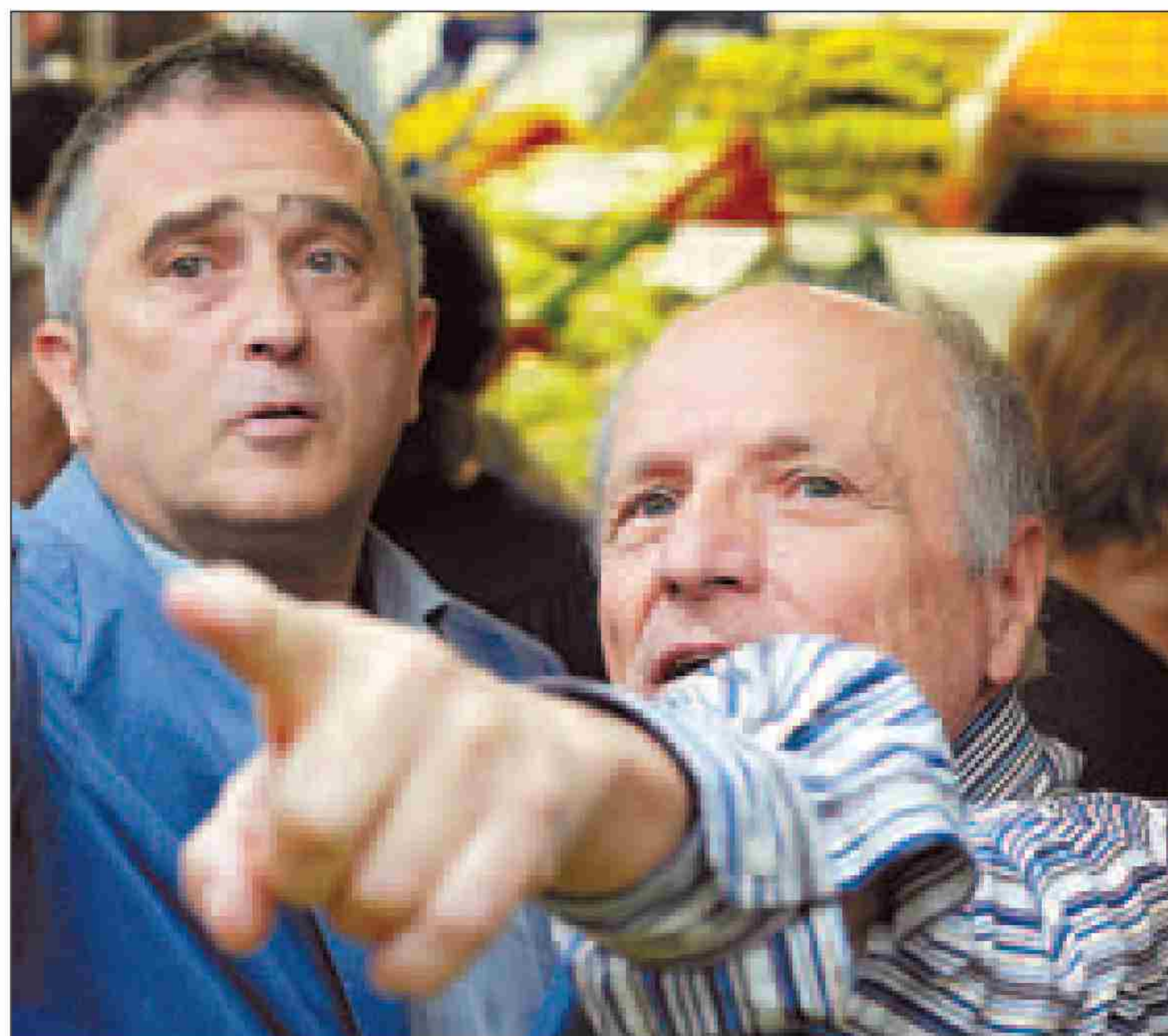
El pintor señala a un vendedor la hortaliza que quiere.

«El trabajo del natural es siempre saludable. Los talleres se componen de gente muy diversa y el bodegón abarca a todos. Hay que partir de algún lugar, porque desarrollar la libertad total en cinco días