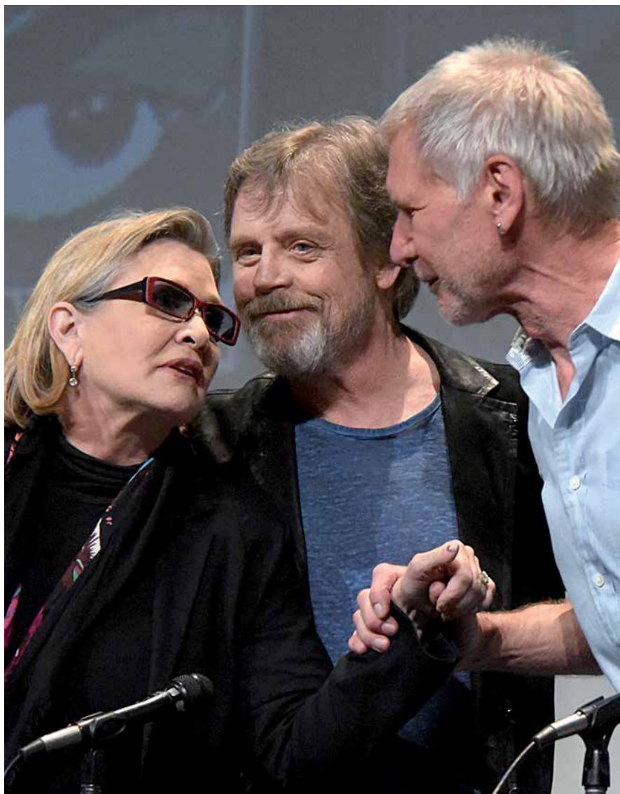
Carrie Fisher, Mark Hamill y Harrison Ford en la San Diego Comic Con 2015.

Los espectadores de 1977 descubríamos las aventuras de un simpático aventurero, Han Solo — Harrison Ford —, de un joven idealista, Luke Skywalker — Mark Hamill —, de una Princesa, Leia Organa — Carrie Fisher —, sin olvidar al malvado Darth Vader — David Prowse — contra quien combatirían nuestros amigos con la ayuda de Obi Wan Kenobi, el caballero Jedi al que Sir Alec Guinness encarnaba