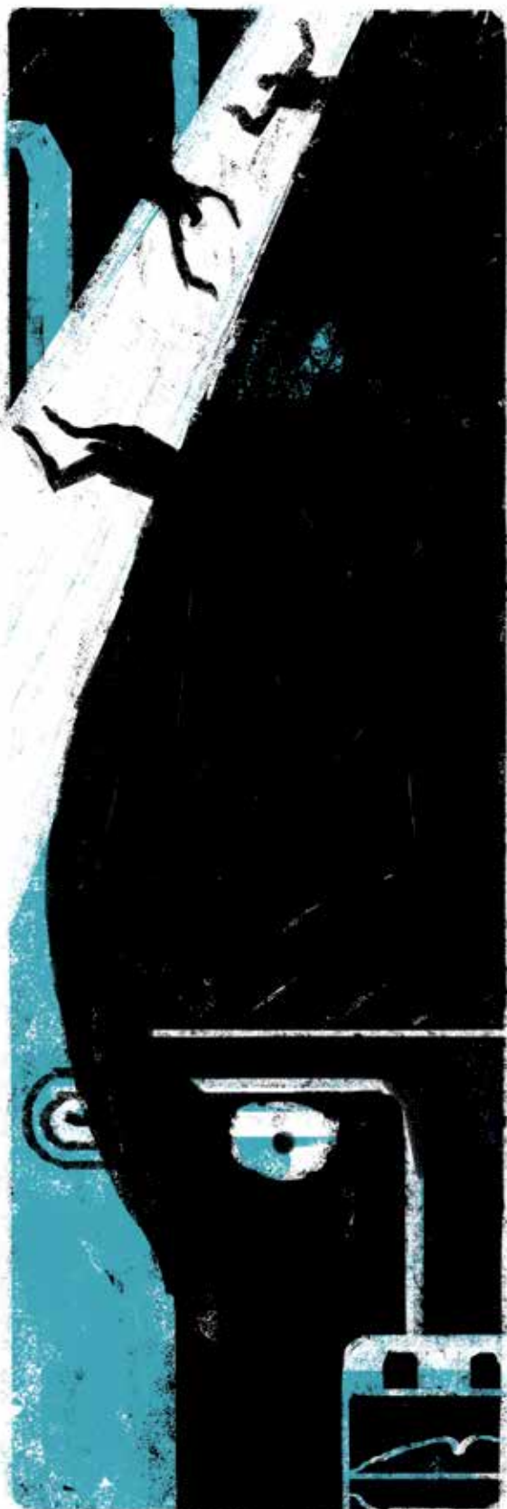
Ilustración Pedro Perles