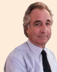
Bernard Madoff, ex presidente del Nasdaq

El mayor fraude de la historia. Bernard Madoff es el responsable de la mayor estafa cometida por una sola persona. Su legado: un fraude de 50.000 millones de dólares (cinco veces el de Enron).