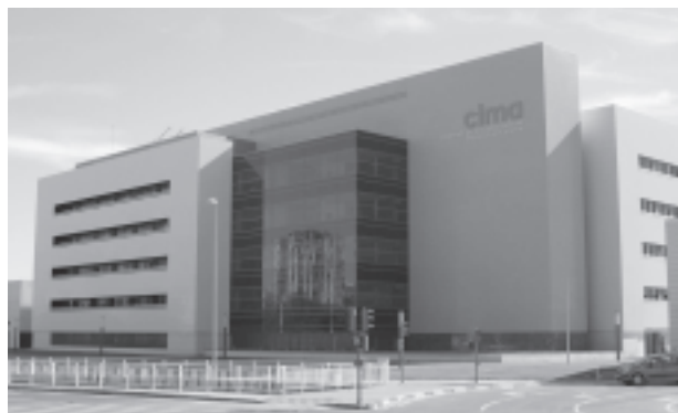
Universidad de Navarra. Edificio CIMA: Centro de Investigación Médica Aplicada