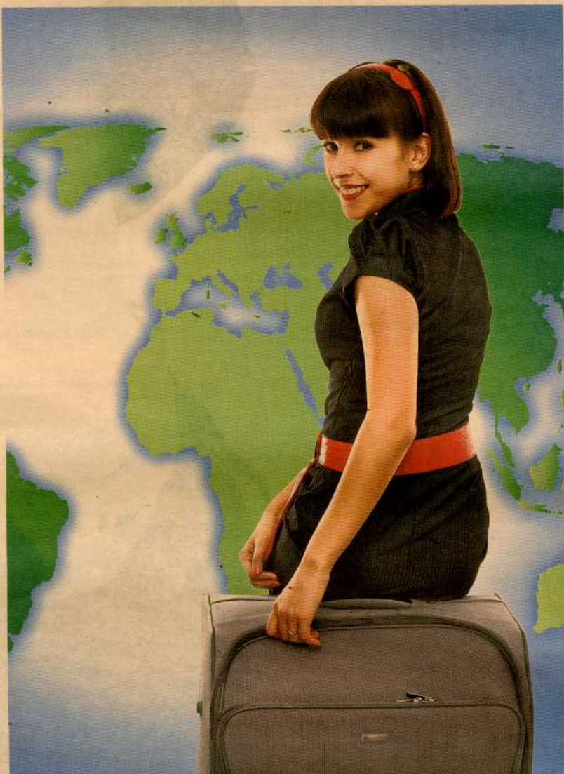
Para muchos recién licenciados la única salida laboral, actualmente, pasa por marcharse fuera a trabajar.