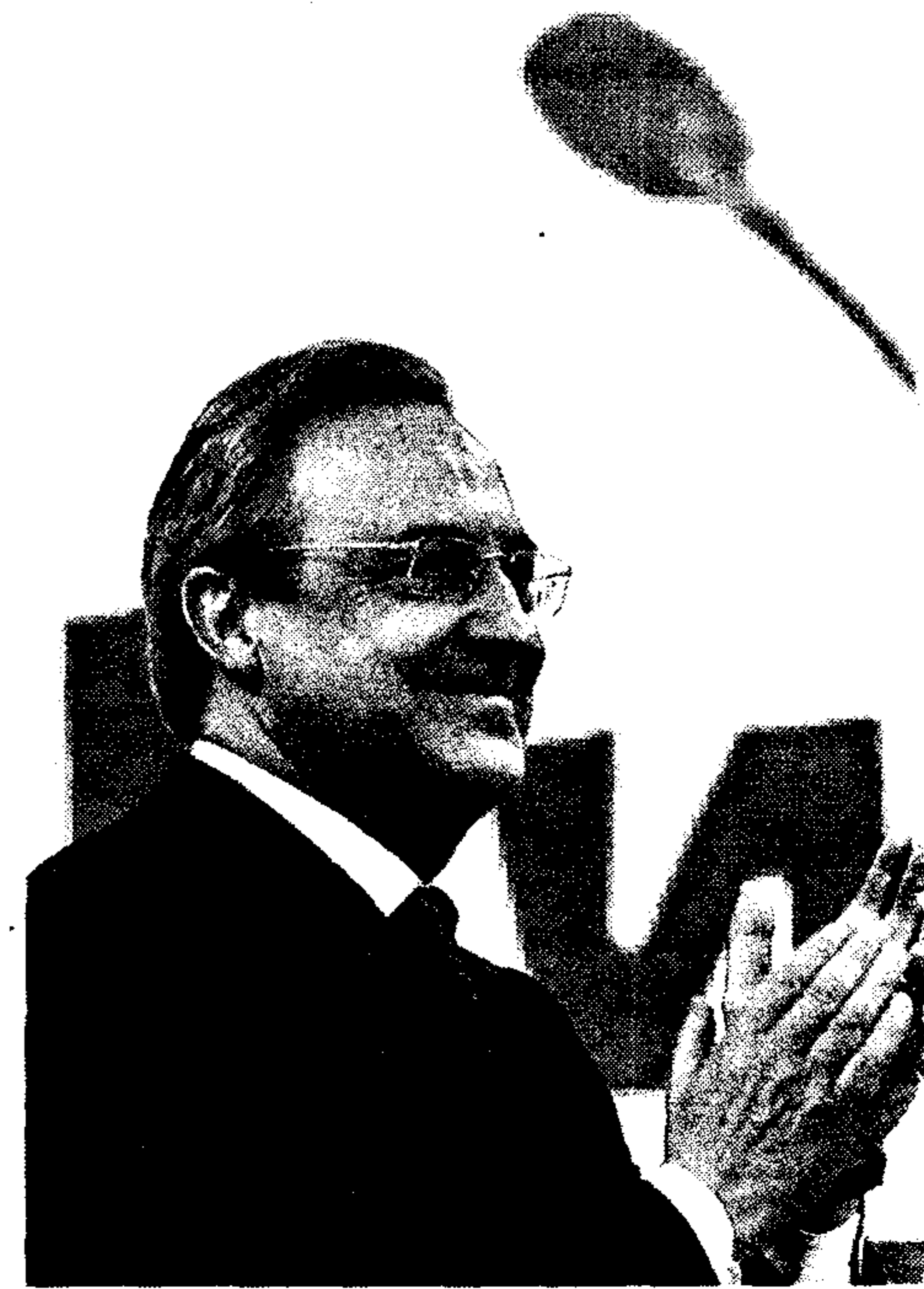
Florentino Pérez aplaude a Cristiano Ronaldo en la histórica presentación del luso en el Bernabéu.

En el capítulo individual, Messi se mantiene como el futbolista con mayor valor mediático del mundo, con 21,6 puntos. Muy cerca del Balón de Oro de la pasada temporada está Cristiano Ronaldo, con 19,6 puntos. El inglés Wayne Rooney, con 13,6 puntos, completa el pódium de jugadores más mediáticos. Kaká, el otro gran fichaje de Florentino, es cuarto y Fernando Torres, quinto.