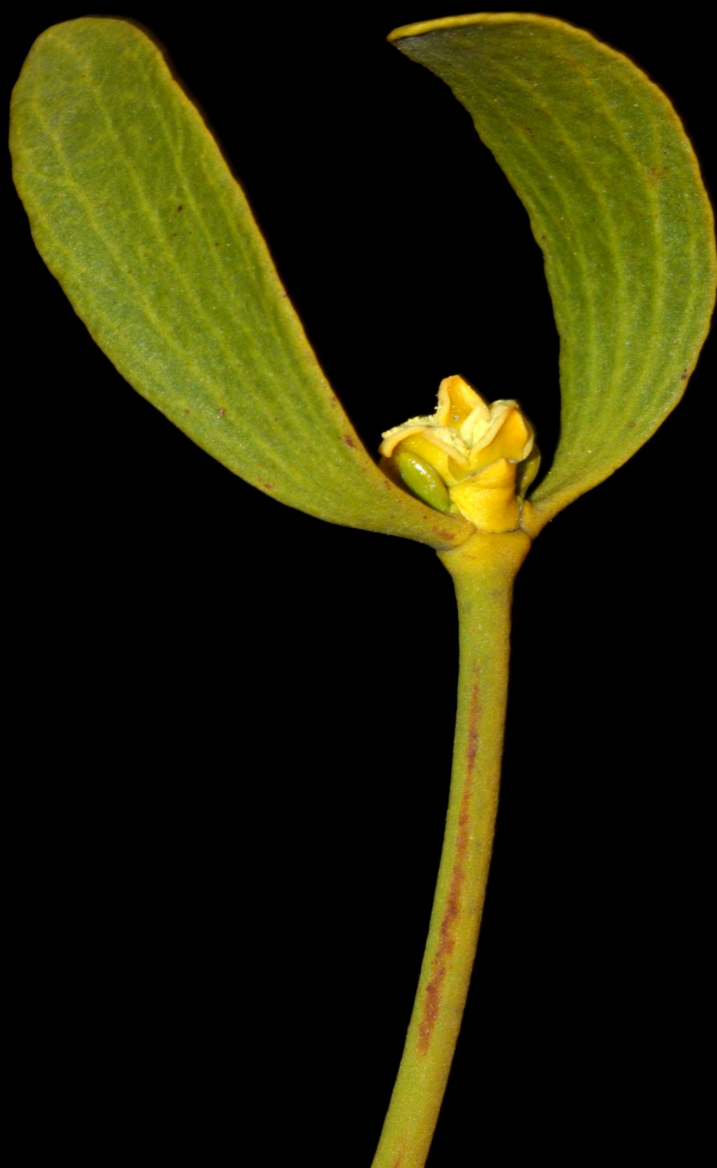
Viscum album . Roncesvalles 2010